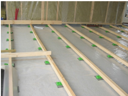
Opklodsning af gulvstrøer

Det forventes også at en bygningsnedker kan lægge gulve. Det kan være alt lige fra prisbillige ”klik gulve” til store solide planke gulve. Bygningsnedkeren laver konstruktionen under gulvet så den er plan og vandret. Herefter kan gulvet lægges. Igen kræver det præcision, når gulvbrædderne skal skæres uden om rør osv.