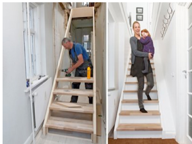
Montering af trapper