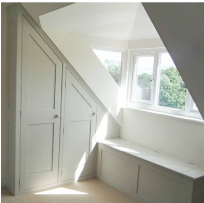
Gipsarbejde i kvistvindue med indbygget specialfremstillet skab og bænke.

Ofte skal der laves huller til spots eller der skal være en indbygget hylde eller reol i gipsvæggen. Det kræver at bygningsnedkeren arbejder præcist og tænker selvstændigt, så det efterfølgende malerarbejde bliver så let som muligt.