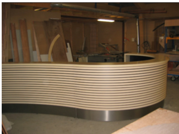
Receptionsdisk fra værkstedet.....

Når værkstedsarbejdet er færdigt, tager bygningsnedkeren ud til kunden for at tilpasse og montere produkterne. Bygningsnedkerens arbejde foregår altså både på værkstedet og på ”byggepladsen”.