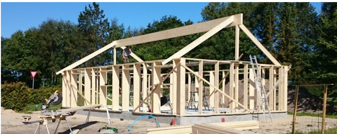
Bygning af sommerhuse

Mange bygningsnedkere finder stor tilfredsstillelse ved også en gang i mellem at arbejde med nogle større dimensioner. Hvis man som bygningsnedker er åben og nysgerrig over for de opgaver man kommer til at arbejde med, udjævnes grænsen mellem bygningsnedker og tømmer mere og mere som årene går og erfaringsgrundlaget bliver større og større.