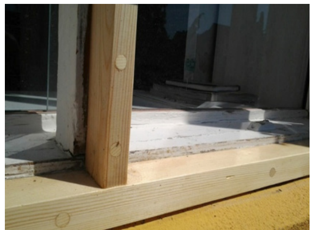
Udlusning af råddent træ i vindue

Denne del af jobbet kræver at bygningsnedkerens varevogn er godt indrettet og indeholder alle de nødvendige materialer og værktøjer.