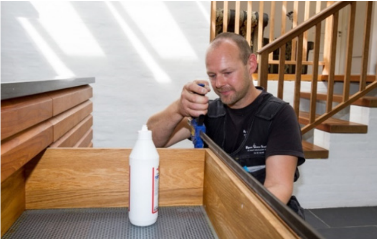
Reparation af køkkenskuffe

Når bygningsnedkeren laver spjældarbejde betyder det, at han kører ud til kunderne – nogle gange helt op til 8 kunder om dagen – og løser mindre opgaver.