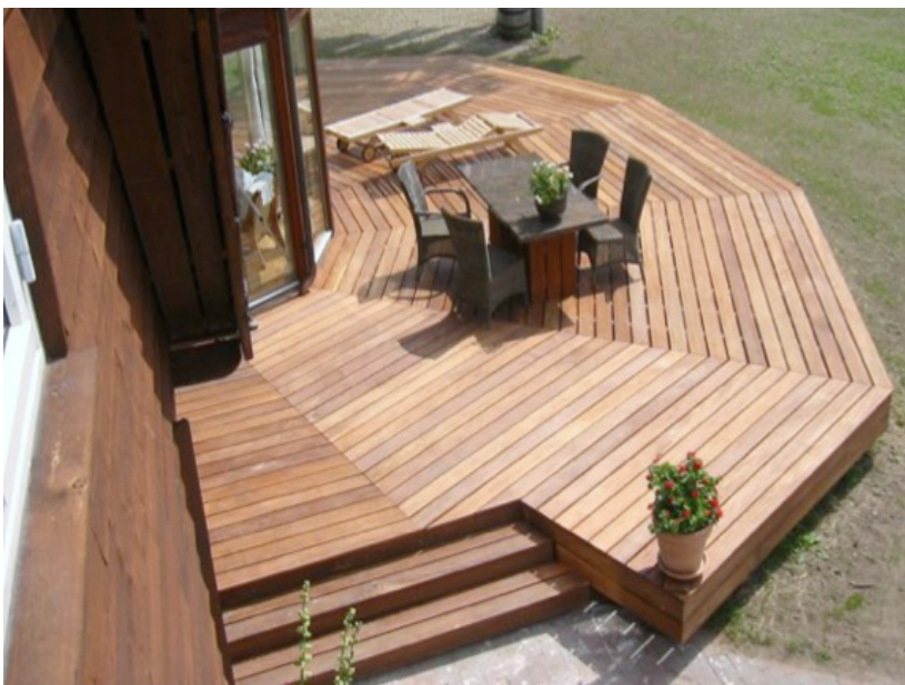
Bygning af terrasser

En bygningsnedker kommer ofte ud for arbejdsopgaver som traditionelt er tømrerarbejde. Det kan fx være bygning af terrasser, sommerhuse, tagkviste osv.