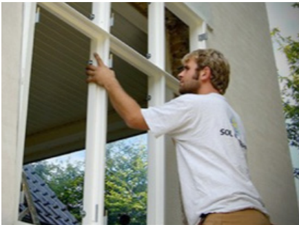
Montering af vinduer og døre

Bygningsdele i standardstørrelser bliver fremstillet på fabrikker. Det kan fx være døre, køkkener eller ovenlysvinduer. Det er bygningsnedkerens arbejde at montere disse produkter ude hos kunden og sørge for at det hele sidder lige i øjet.