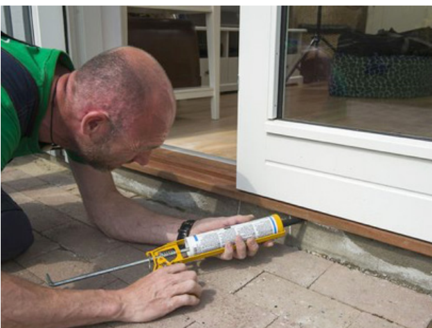
Eftergang af fugen omkring en terrassedør

Det kan være reparation af en køkkenskuffe eller reparation af hængsler, låse, håndtag eller dørpumper. Det kan være udskiftning af skurelister i et køkken, udskiftning af et vinduesglas, udlusning af råddent træ i et bundstykke på en dør, justering af køkkenlåger og skuffer, lægning af et laminatgulv i en entré, reparation af en vinduesramme efter indbrudsskade, kontrol af fugen rundt om et vindue, montering af en inspektionslem i en gipsvæg, opretning af et gulv der er sunket og et utal af andre mindre opgaver.